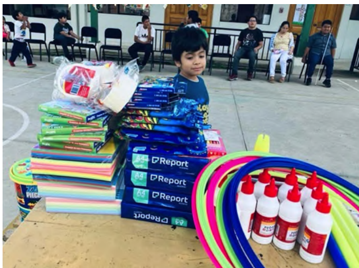
Une partie des effets scolaires achetés pour soutenir des activités scolaires et ludiques.

À la fin d'avril et au début de mai, les rencontres «Retrouvailles» de chacun des groupes ont permis de recueillir les commentaires des bénévoles voyageurs.