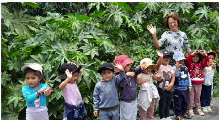
Une bénévoles et les tout-petits. Azama de Esperanza près d'Otavalo.