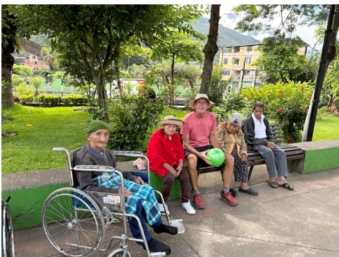
Petite pause pour notre bénévole et des personnes âgées de la Casa Hogar municipal del adulto mayor.