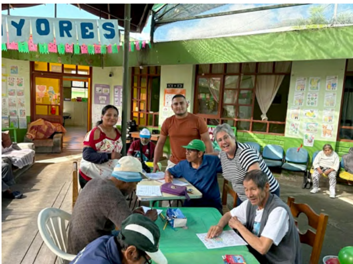
Atelier créatif à la Casa Hogar municipal del adulto mayor.

De plus, les évaluations des séjours par les partenaires du Pérou et de l'Équateur ont aussi été traitées avec attention et un rapport sommaire a été présenté aux membres du CA. Nous sommes régulièrement en contact avec nos quatre principaux partenaires de façon à demeurer bien au fait du climat politique et social des pays où des séjours sont organisés.