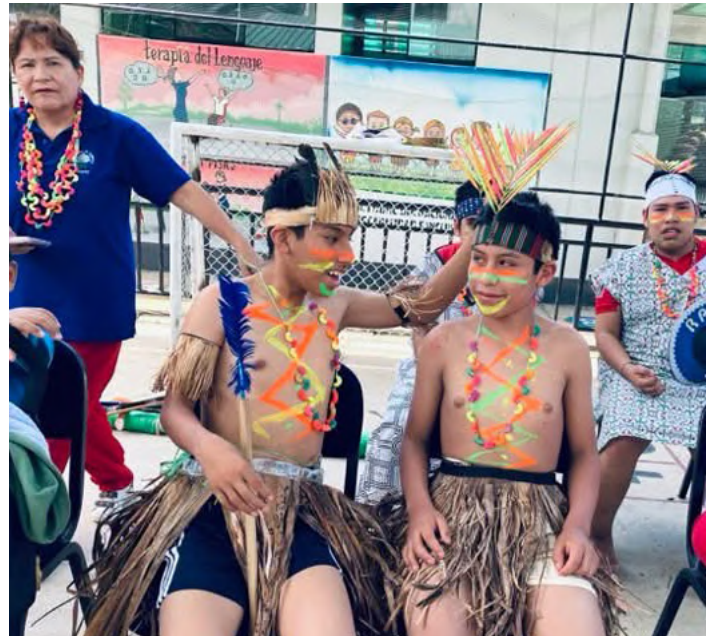
Une fête colorée, organisée par nos bénévoles, Complejo de educación básica especial (CEBE) Rosa de America, Quillabamba.