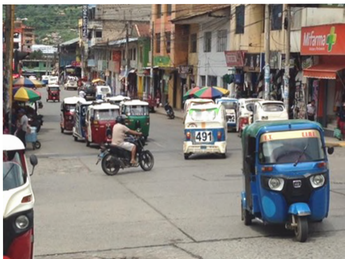
Heure de pointe à Quillabamba !